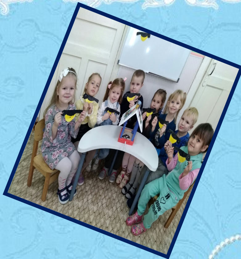
Рисование: «Птичка синичка»